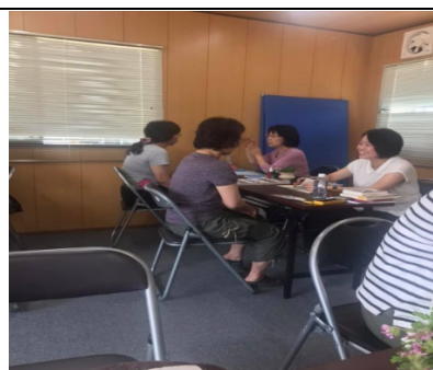
フラワーエッセンスカウンセリングの様子