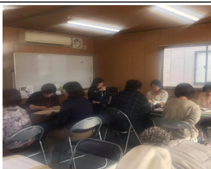
ボランティアの様子