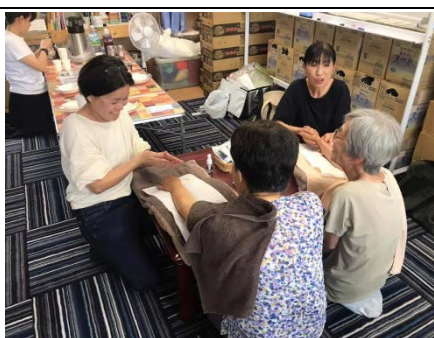
ハーブティカフェの様子