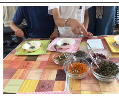
バスソルトづくりの様子