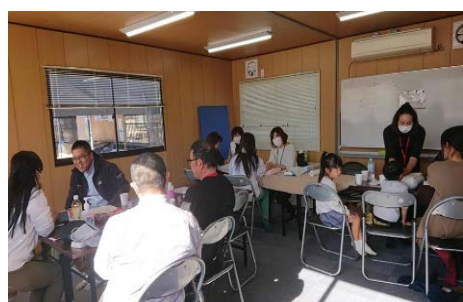
ボランティアの様子