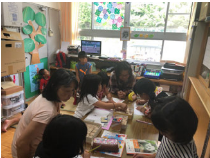
みんなでお絵かきやぬりえ