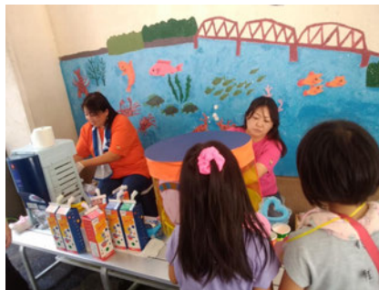
縁日（綿あめ・かき氷）