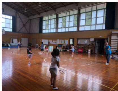
バドミントンやドッジボール