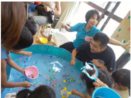
縁日（スパボルスくい）